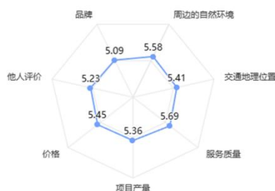
图 1 影响消费者选择共享农场的各要素

用。服务质量以 5.69 的高影响值，成为调查对象选择过程中最关键的因素，这可能由农场多元业务模式以及消费者放松娱乐的内在需求共同决定的。环境要素（5.58）、价格要素（5.45）、地理要素（5.41）紧随其后，体现了调查对象在选择共享农场时，周边的自然环境、农场性价比、交通便利性也是主要考量因素。