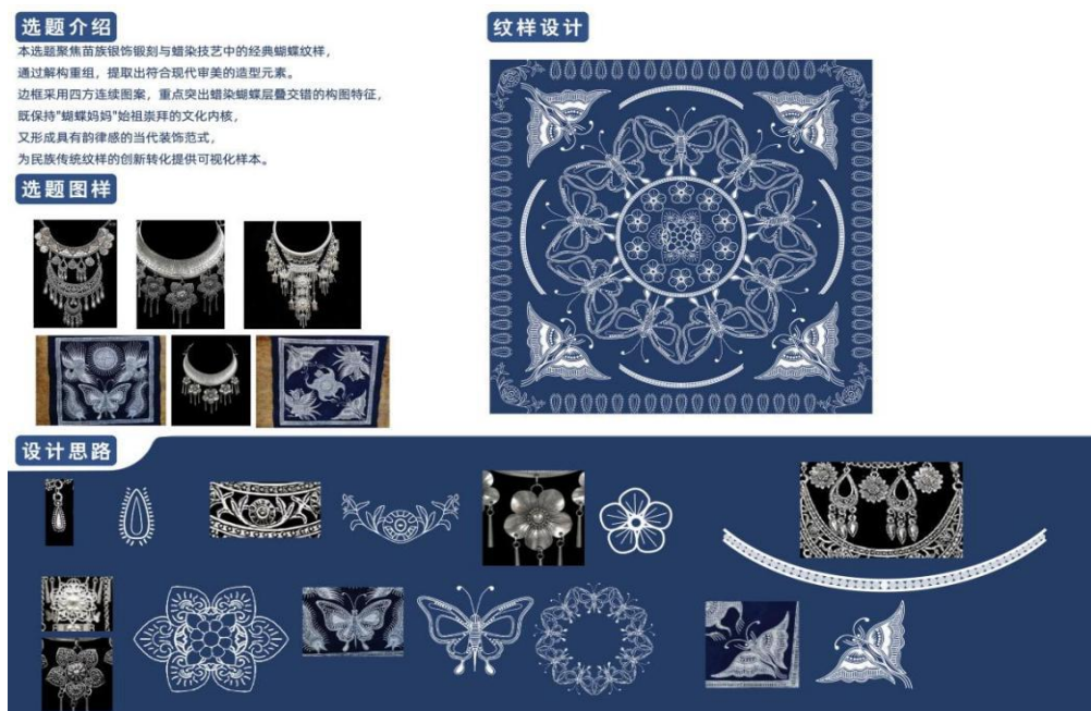
图一 苗族服饰纹样创新设计

（1）苗族服饰纹样创新设计。如图一，该生作品以苗族“蝴蝶妈妈”始祖崇拜文化为内核，提取苗族经典蝴蝶纹样，形成简洁、对称的几何化造型，既保留传统蜡染的层叠交错特征，又融入现代审美中的抽象与秩序感。蝴蝶纹样以叠加、穿插的方式呈现，象征生命的繁衍与文化的传承。纹样间的虚实对比与疏密分布，既模仿蜡染浸染的自然肌理，又赋予画面动态平衡，增强视觉张力。设计中还融入了苗族银饰中的梅花纹样，与蝴蝶纹样交相辉映，体现了苗族“万物有灵”的自然观，同时通过抽象化处理，使苗族传统符号更具普适性与装饰性。