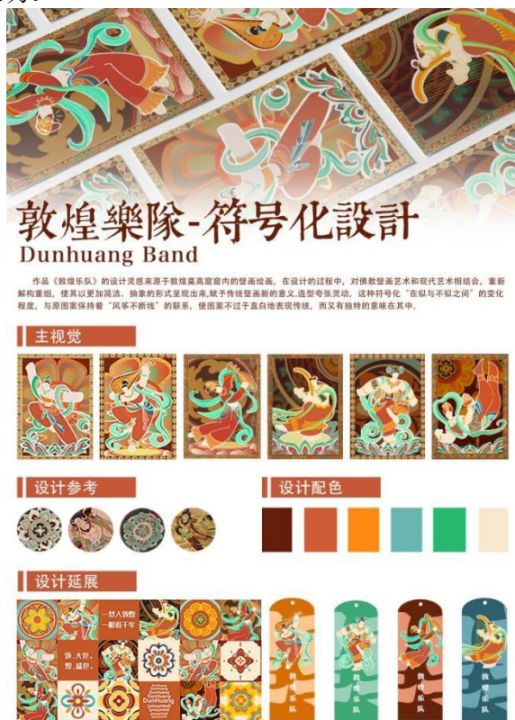
图四 敦煌乐队—符号化设计

《敦煌乐队》以“色彩提纯-图形凝练-叙事重置”为核心策略，将敦煌壁画艺术转化为现代符号化设计。色彩上融合朱红、石绿等传统矿物色调与荧光橙、金属金，在古朴底色中注入潮流张力；图形对飞天、藻井进行几何抽象，以简练弧线勾勒动态韵律，通过“似与不似”的符号平衡、保留文化神韵；风格糅合壁画“吴带当风”的流动感与现代极简的网格秩序，以扁平化剪影与负空间留白重构视觉语言；将佛教“天宫伎乐”转译为当代乐队叙事，通过潮流衍生等跨界应用，使宗教符号蜕变为艺术自由与大众审美的载体。作品以“形散神聚”的再创造，融合与文化转译，将敦煌壁画艺术转化为现代符号化设计，既延续传统文脉，又赋予其当代生命力。