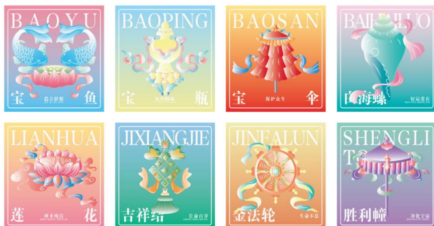
图三 藏传八吉祥纹样转译设计

该生作品通过“符号提取-结构简化-语义重构”的完整路径，实现了传统纹样的现代转译。符号提取以藏传八吉祥为核心，显性提取藏族八吉祥纹样“宝瓶”“金法轮”“莲花”等宗教符号，通过“生命不息”等短语将宗教寓意拓展为生态保护等普世价值观。将繁复纹样进行结构简化，强化视觉秩序。最终完成从传统法器到时尚单品、数字文创的跨界再生，既保留文化基因，又注入现代生命力(见图三)。