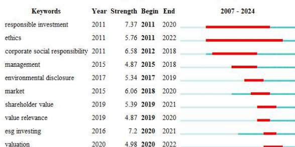
图 4 WOS 核心数据库关键词突现图

上图分别为 CNKI 与 WOS 核心数据库 ESG 相关文献生成的关键词突现，国内研究提取的 10 个突现关键词可以以 2020 年为时间节点分成两个阶段。在 2020 年之前主要研究点可以包括责任投资、信息披露、公司治理